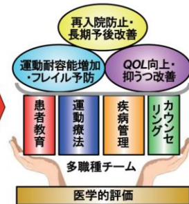
心臓リハビリテーションの概念の変遷