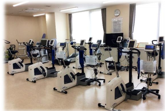
はりまの心臓リハビリテーション室